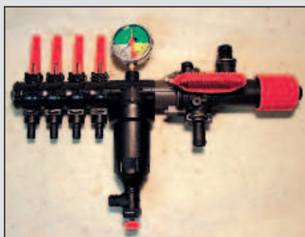
Pretočni regulator PR 3 CF/4