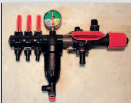
Pretočni regulator PR 3 CF/3