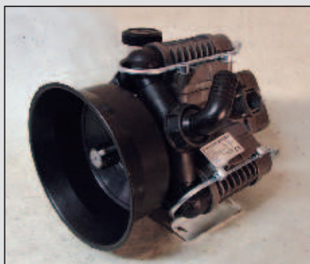
Črpalka BM 105/20