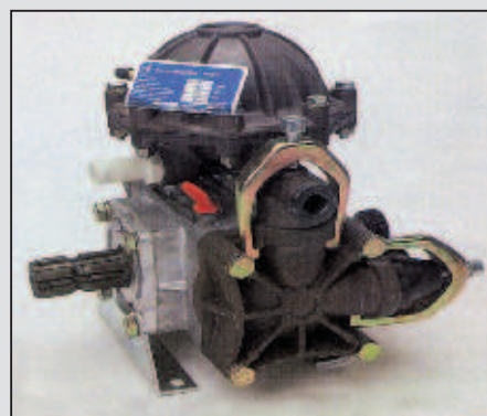
Črpalka BM 65/30